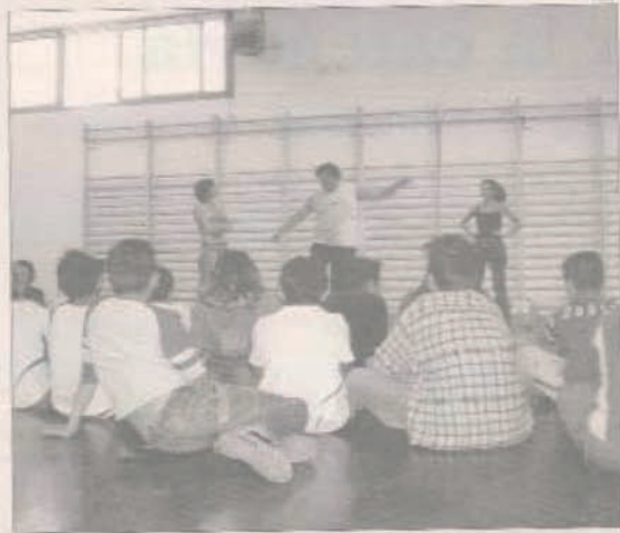
Un moment de l'obra a l'IES Fórum, a la Mina

Quatre actors i cap guionista prevl escrit. Improvisar per sorprendre i fer reflexionar. Però no a un públic qualsevol: una trentena de nens i nenes d'entre 11 i 12 anys, de l'escola CEIP Mediterrània, del barri de la Mina. Lloc: el gimnàs de l'IES Fórum. Resultat: canalla aplaudint i demanant un bis. Un pas divertit dins el programa contra l'absentisme escolar que contempla el Projecte Educatiu de Sant Adrià.