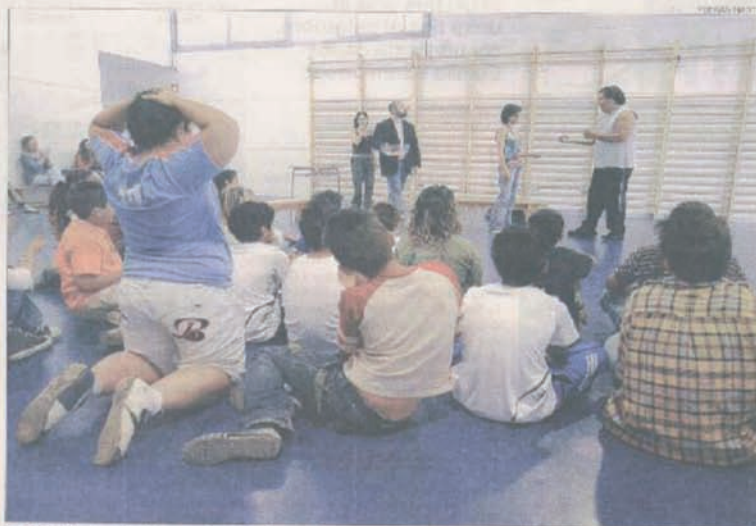
▶▶ Estudiants de la Mina contemplant l'obra de teatre que promou la continuïtat escolar, dimarts.

ACTORS PRÒXIMS / Com a activitat estel·lar el consell ha preparat una obra de teatre sense guió que imparteix pedagogia sobre la necessitat de continuar els estudis. Tres actors van entretenir aquest dimarts els